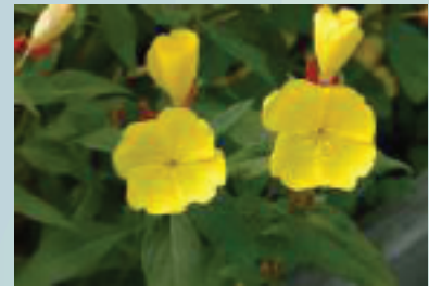
Flor de muerto ( Oenothera tetragona )