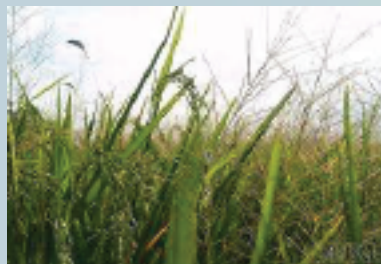
Zacate de agua ( Leptochloa spp )