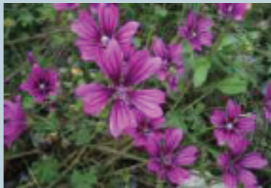
Malva ( Malva silvestris )