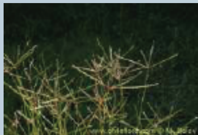
Pata de gallina ( Digitaria sanguinalis )