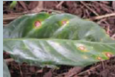
Mancha de hierro del café ( Cercospora coffeicola )