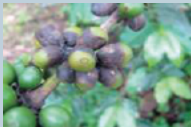
Antracnosis en café ( Colletotrichum coffeanum )