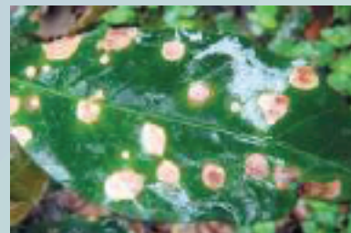
Ojo de gallo del café ( Mycena citricolor )