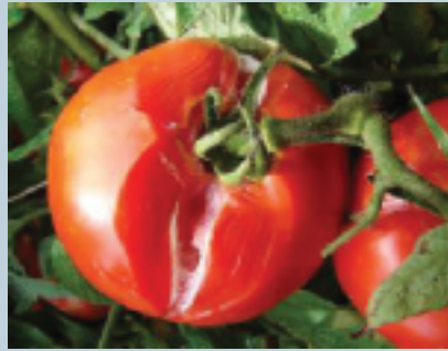
Pudrición ( Geotrichum candidum )