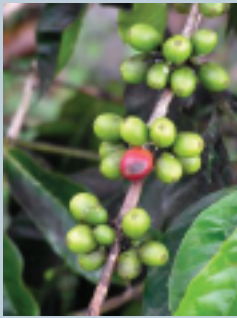
Mancha de hierro ( Cescospora coffeicola )