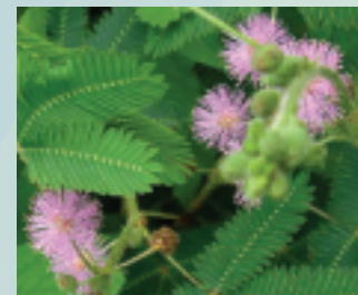
Dormilona, sensitiva ( Mimosa pudica )