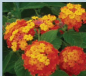
Cinco negritos ( Lantana camara )