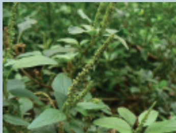
Bledo ( Amaranthus viridis )