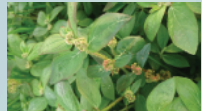
Lechosa ( Euphorbia hirta )