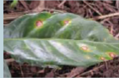
Mancha de hierro del café ( Cercospora coffeicola )