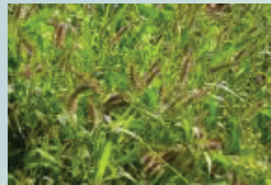
Cola de zorro ( Setaria geniculata )