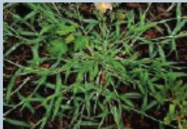
Guarda rocío ( Digitaria sanguinalis )