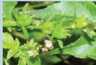
Papayita ( Croton lobatus )