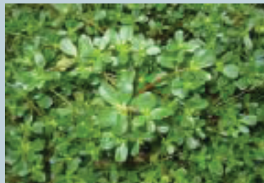
Verdolaga ( Portulaca oleracea )