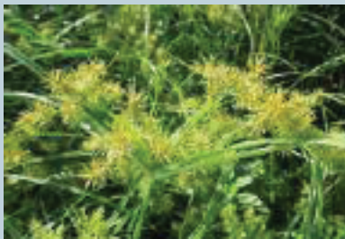
Coyolillo ( Cyperus flavus )